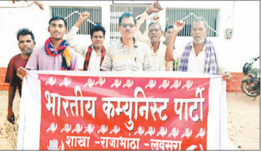
भारतीय कम्युनिस्ट पार्टी के बैनर तले प्रदर्शन करते लोग।