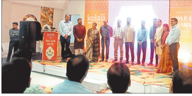
समारोह में उपस्थित अतिथि एवं अन्य लोग।

कोसाला कारीगर शिल्प उन्नति योजना के तहत रायगढ़ स्थित केंद्र के तकनीकी सहयोग से कोसाला द्वारा आयोजित उन्नत बुनाई कार्यशाला को सफलतापूर्वक पूरा करने वाले 20 बुनकरों को प्रमाण पत्र प्रदान किए गए। इसके अतिरिक्त 16 बुनकरों को पहचान कारीगर कार्ड जारी किए गए। कोशल संवर्धन, क्षमता निर्माण और प्रासंगिक सरकारी योजनाओं तक पहुंच को सक्षम बनाने पर केंद्रित थे पहलें,