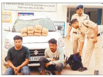
पुलिस के साथ गिरफ्तार आरोपी व जब्त गांजा।

कार में गांजा की तस्करी करते दो आरोपियों को पुलिस ने गिरफ्तार किया है। आरोपियों के कब्जे से 9 किलो से अधिक गांजा बरामद किया गया है। जब्त गांजे की कीमत 4 लाख 55 हजार रुपए बताई जा रही है।