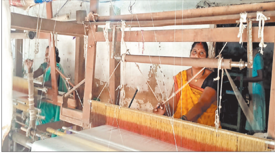
हाथकरघा मशीन से कपड़ा बुनाई का कार्य करती महिला।